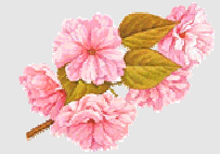
Prunus da fiore